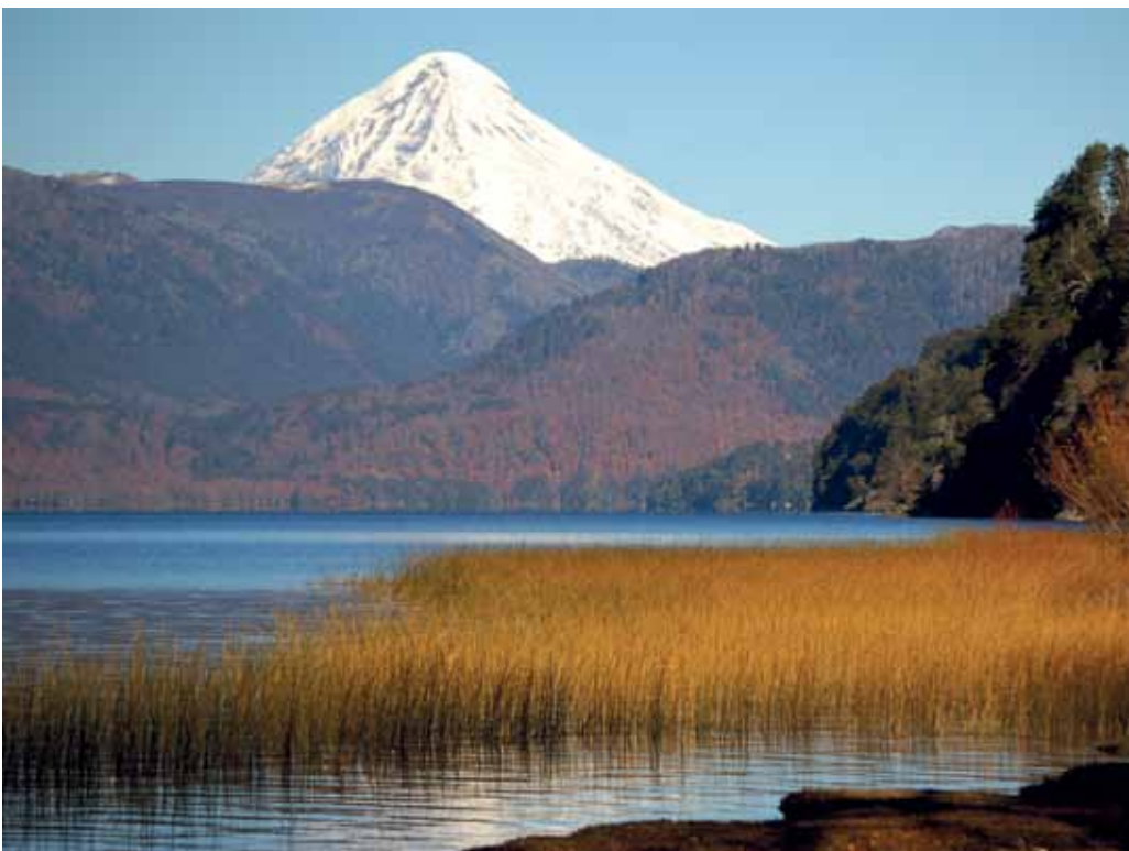
San Martin de los Andes, Argentinien

Este curso está dirigido a todas las personas que ya tienen un nivel avanzado de la lengua española. Aquí vamos a conversar y discutir sobre temas actuales en España y América Latina, en especial sobre historia, literatura y política. Leemos artículos periodísticos y de la revista »ECOS«, ampliamos el vocabulario, afirmamos la gramática y reflejamos el uso apropiado de la lengua.