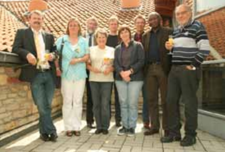
LehrerInnen-Team der VHS in den Schulabschlusslehrgängen nach der feierlichen Zeugnisübergabe