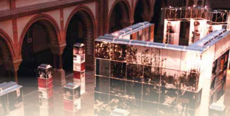
Plakat und Bildrechte: Stiftung Denkmal